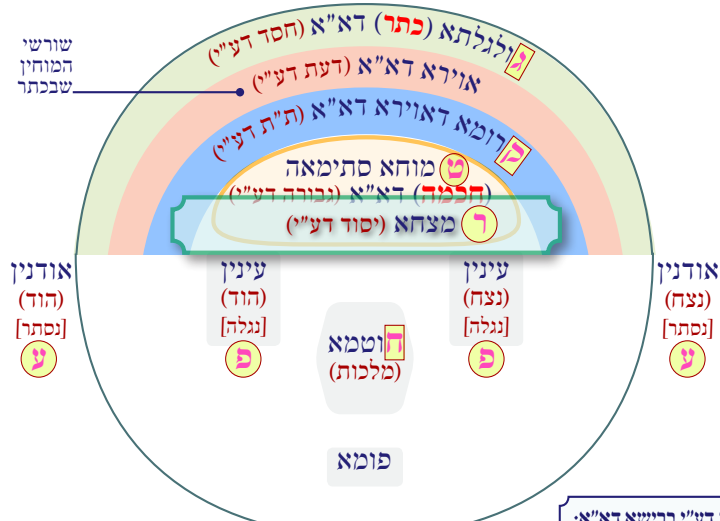
גרין (בינה) דא"א

הערות בענין התלבשות ז"ת דע"י ברישא דא"א: * התלבשות בהארות, מלבד ההתלבשות הרגילה (ז"ת דעליון מתלבש ב"ס דתחתון). * ז"ת דע"י, הכוונה יומם דכולהו.